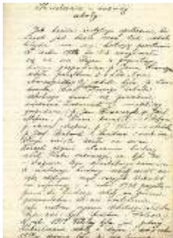
Tak wygląda okładka zeszytu i jego pierwsza karta - istna skarbnica wiedzy o szkole i tamtych czasach. Choć podany jest rok szkolny 1921-22 to zapiski dotyczą i lat późniejszych